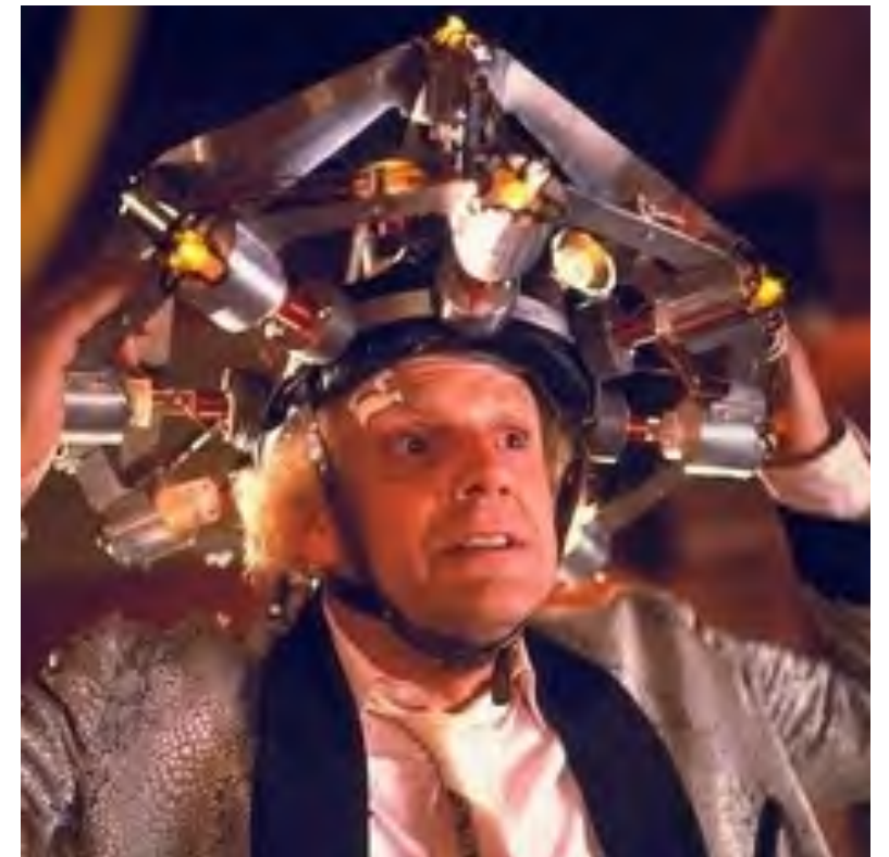
로버트 저메스키, 〈백 투 더 퓨처〉 조나단 스위프트, 〈걸리버 여행기〉